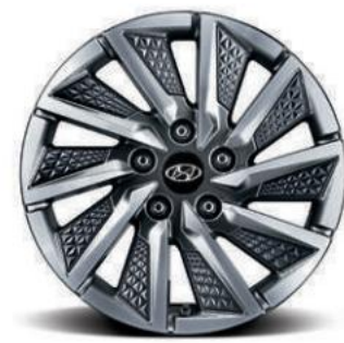
16 inç aliazh