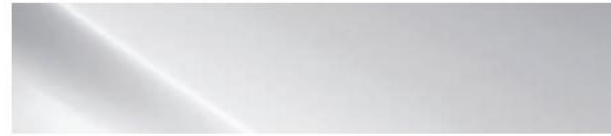
Polar White (WAW)