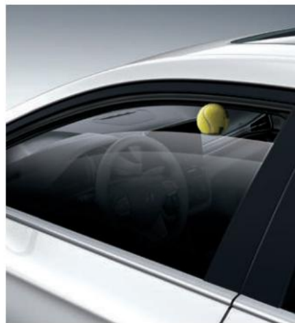
Kontrollet e dritareve elektrike të sigurisë