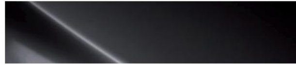
Iron Gray (YT3)