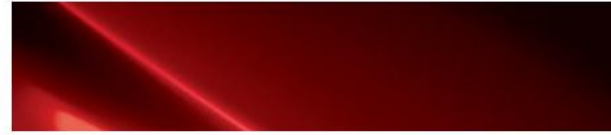
Fiery Red (PR2)