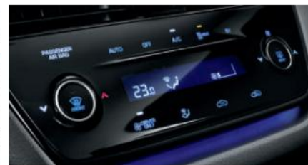
Kontrolli i klimës vetëm për shofer Frena parkimi të tipit elektrik