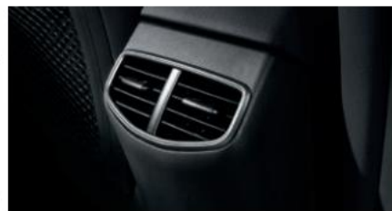
Ventilimi i sediljeve të pasme Kuti ingranazhesh sekuenciale me leva në timon (kontrolli rigjenerues i frenimit)