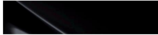
Phantom Black (NKA)