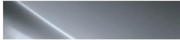
Fluidic Metal (M6T)