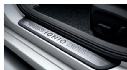
Dritat e përparme LED Pragjet e detyrve me krom me logon IONIQ të stampuar