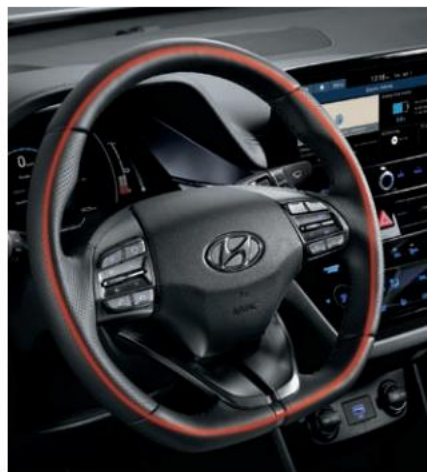
Ngrohja e timonit

Modeli GLS me pajisje shtesë është paraqitur këtu.