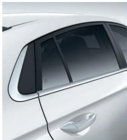
Pjesa fundore e dritareve me krom