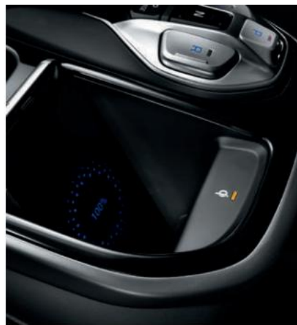
Sistemi i karikimit të smartfonëve