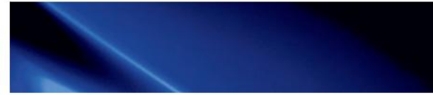
Intense Blue (YP5)