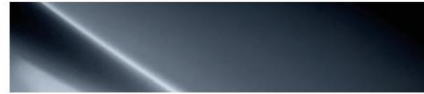
Electric Shadow (USS)